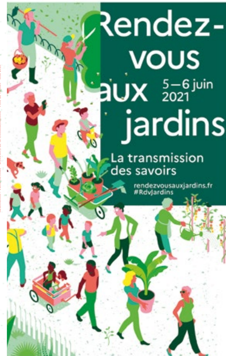
Réalisation : Yann Cérifac - Direction de la Communication - Ville de Nîmes - mai 2021

PROGRAMME SOUS RESERVE DE MODIFICATION Toutes les animations sont gratuites. Le nombre de participants et les modalités d'accès seront établis en fonction des recommandations sanitaires en vigueur au moment de l'événement. Retrouvez ces rendez-vous sur nimes.fr et sur l'agenda de l'application smartphone gratuite « Ville de Nîmes » Renseignements : Service valorisation et diffusion des patrimoines Direction des affaires culturelles Ville de Nîmes - 04 66 76 70 61 - www.nimes.fr